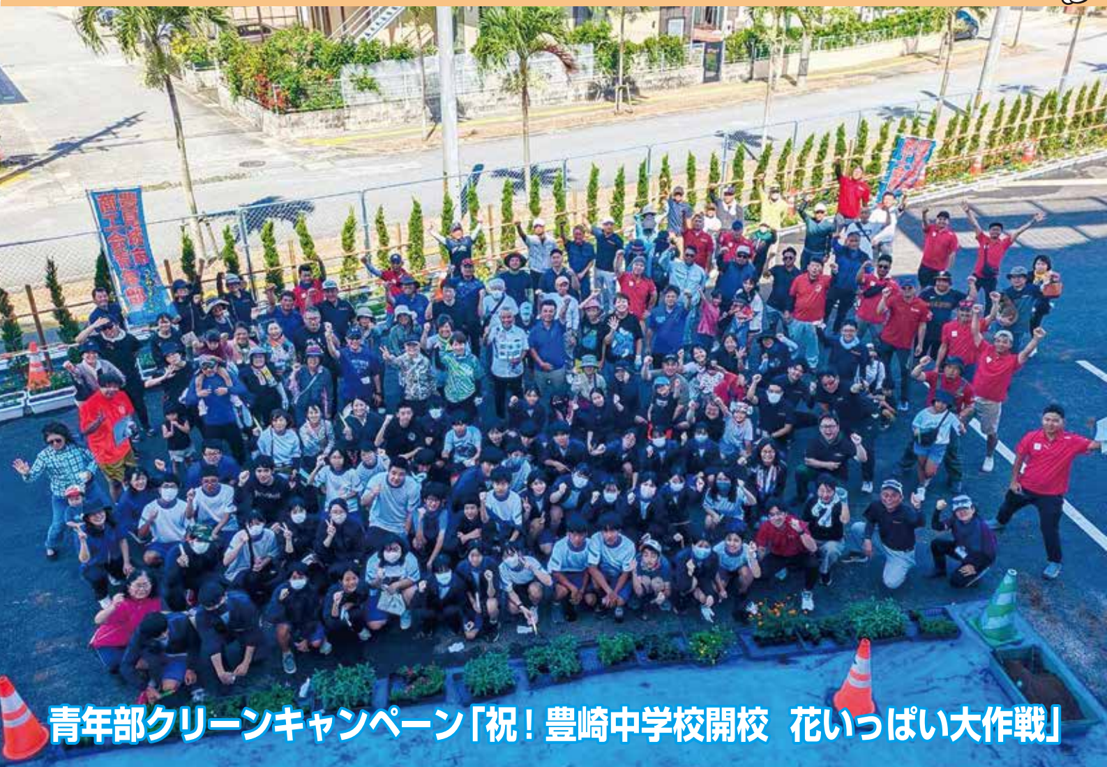
青年部クリーンキャンペーン「祝！豊崎中学校開校 花いっぱい大作戦」