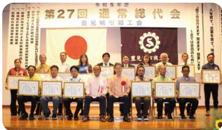
永年勤続優良従業員表彰受賞者の皆様と上原会長(中央左)、沖縄県商工会連合会米須会長(中央右)