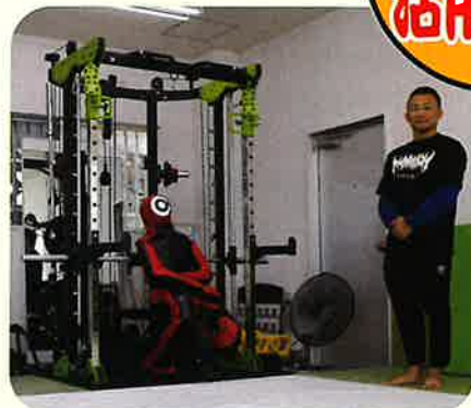
補助金活用で導入した最新トレーニングマシン