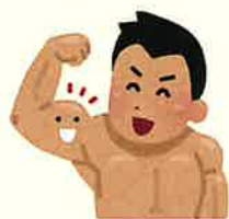
小島氏は現役格闘家BJとして活躍！