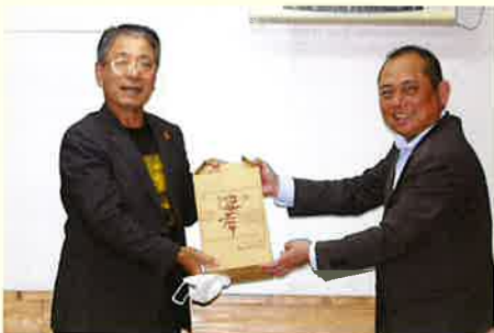
本部町との意見交換会